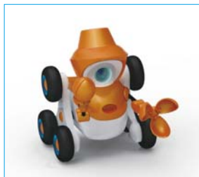
「橋 - Tachibana -」