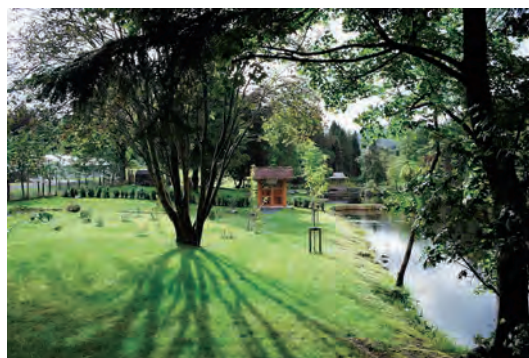
写真-24 南側南門入口全景写真