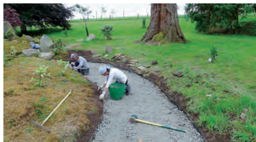
写真-16 枯山水縁留め工事