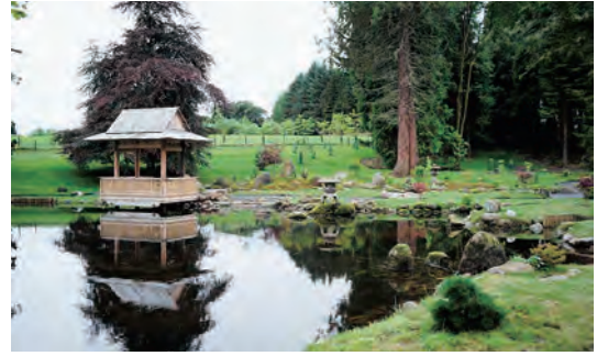
写真-46 西側中島より南西側四阿、平庭枯山水全景写真