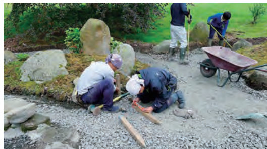
写真-14 枯山水路床砂利敷き工事