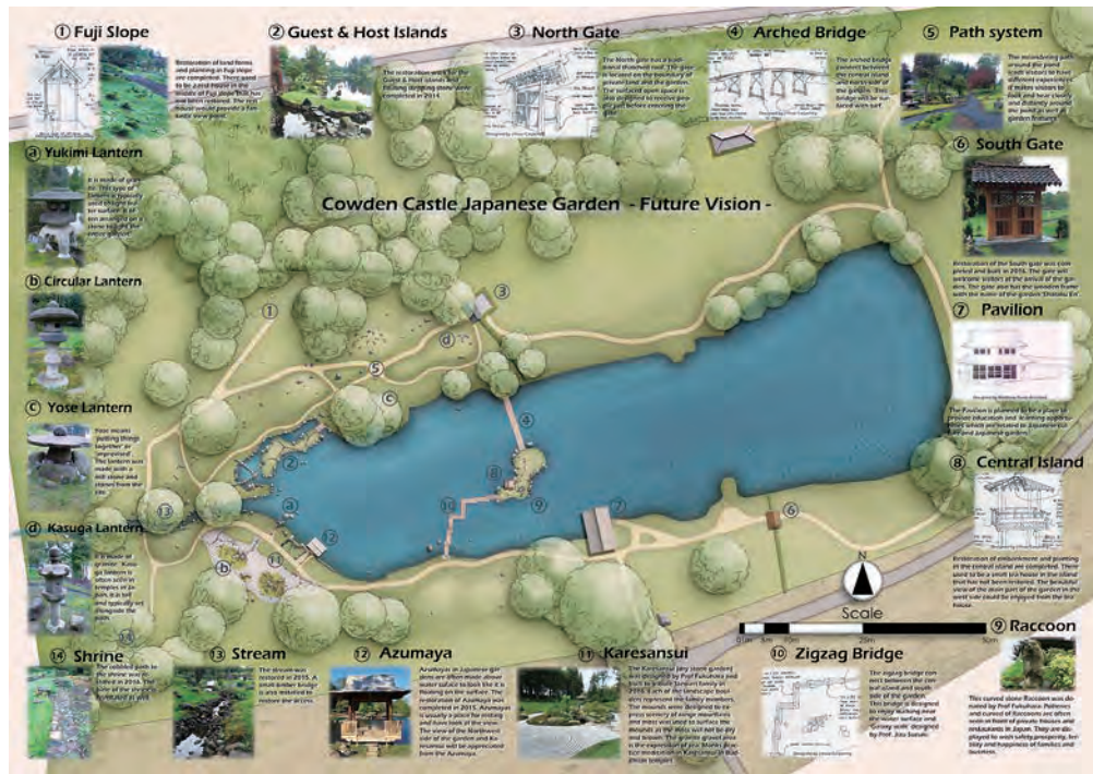
図-1 庭園復元・作庭完了図、将来計画図(2016年10月作成)