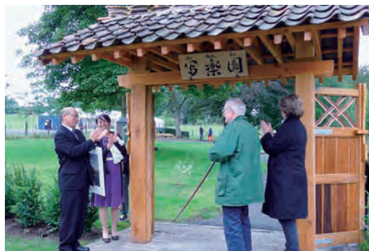
写真-23 ロバート卿 誕生記念「写楽園」特別公開