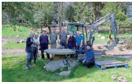
写真-8 寄せ灯籠設置工事