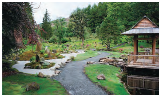
写真-33 南西側平庭枯山水全景写真