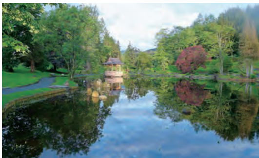
写真-27 南東八橋から西側庭園全景