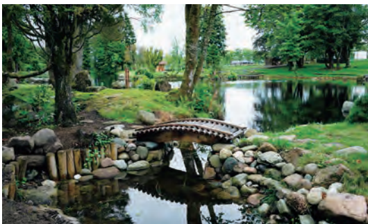
写真-45 西側中島に架かる木橋復元全景写真