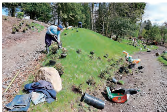
写真-4 フジスロープ配植、植栽工事