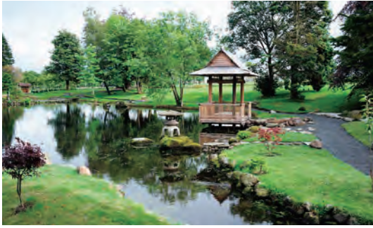
写真-42 北側より四阿、雪見灯笼復元全景写真