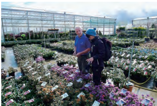
写真-1 ナーサリーにてフジスロープ、北側庭園周辺植栽樹木選定

②作業内容：グラスゴー近くのcraigmarloch 植木ナーサリーにて、フジスロープ、流れ周辺植栽のため植木選定と買付、午後現場確認、段取打合せ、大工と細部の打合せを行った。