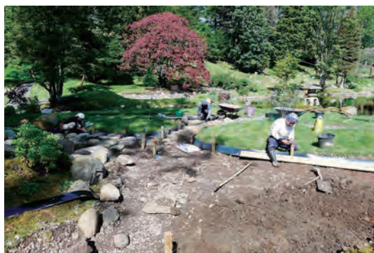
写真-13 枯山水白砂敷き準備工事、飛石設置工事