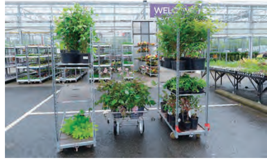
写真-9 ナーサリーにて流れ周辺植栽樹木選定