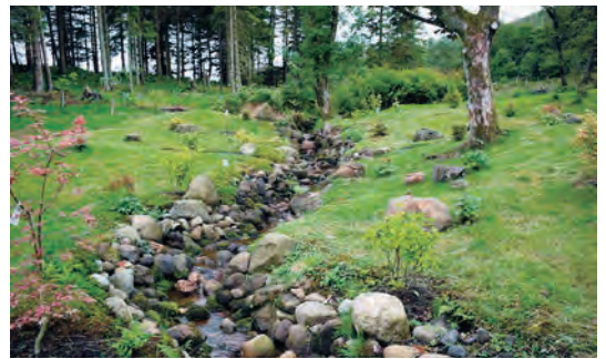
写真-40 北西側流れ復元全景写真