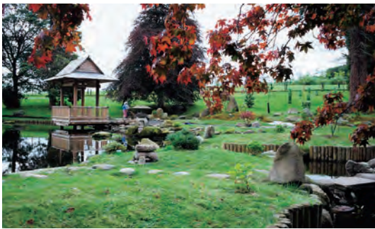
写真-44 西側中島より南西側四阿、平庭枯山水全景写真