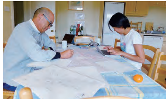
写真-10 植栽、白砂数量算出