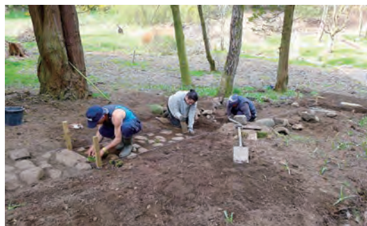
写真-6 参道石畳復元工事