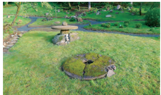
写真-49 北西側平庭寄せ灯笼復元写真