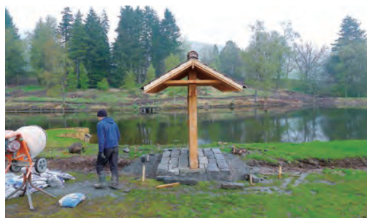
写真-7 南門石張り工事