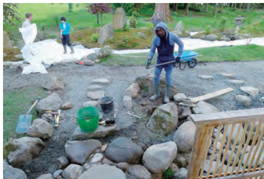
写真-19 枯山水防根シート敷設、四阿前景石、飛石設置工事