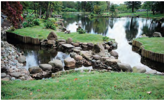
写真-43 西側中島、沢飛、岩島、州浜復元全景写真