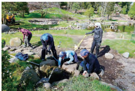
写真-5 水鉢前石設置工事