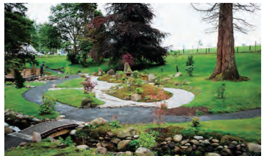
写真-41 南西側平庭枯山水全景写真