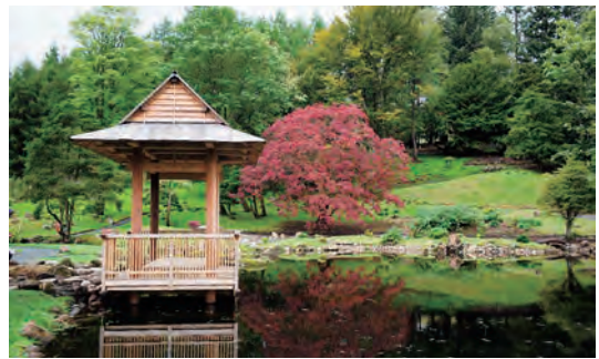
写真-32 復元された四阿、北側フジスロープ全景写真