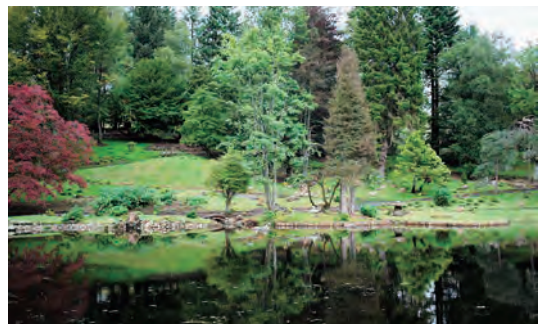
写真-31 南側園路から北側庭園全景写真