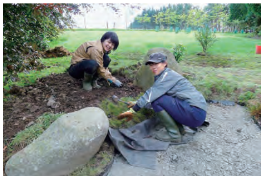
写真-18 枯山水縁留め芝生植栽工事

②作業内容:お社参道玉石敷き工事、ベンチ設置工事、 四阿取付き飛石設置工事、枯山水縁留め芝生、苔植 栽工事。