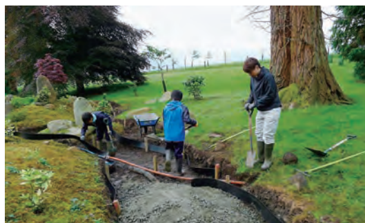
写真-15 枯山水縁留め設置工事