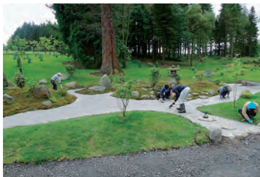
写真-20 枯山水白砂敷き工事