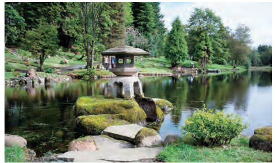
写真-39 復元された雪見灯籠全景写真