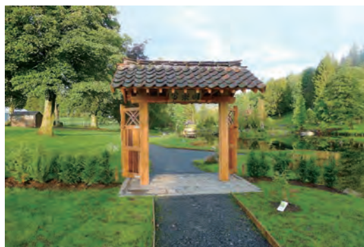
写真-25 南門復元全景写真