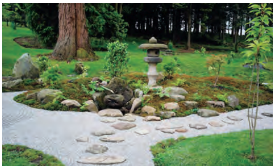
写真-37 南西側平庭枯山水全景写真