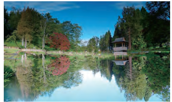
写真-53 庭園名の心を映したかのような復元庭園写真