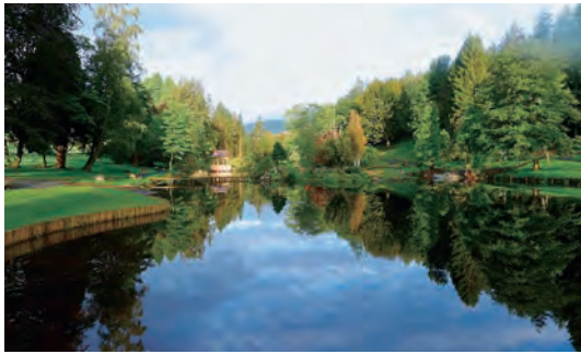
写真-26 南東南門から西側庭園全景写真