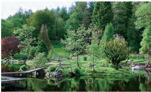
写真-28 池中央中島復元全景写真