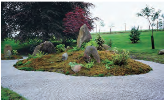
写真-36 南西側平庭枯山水全景写真