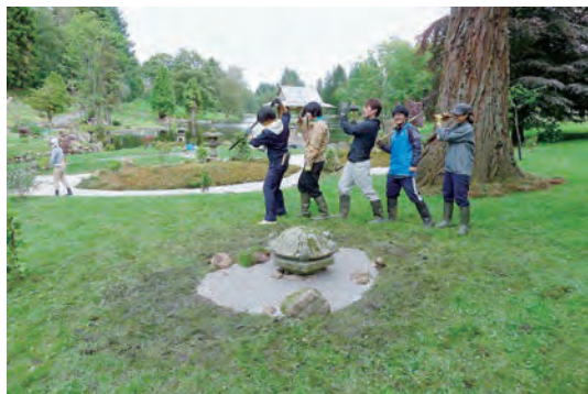
写真-21 既存灯籠傘、中台保存配置、仕上げ工事