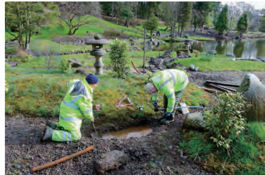
写真-2 西側平庭水鉢給水管作業