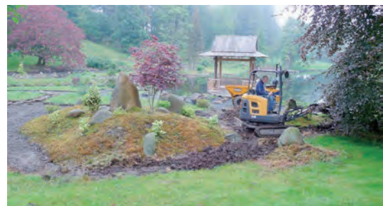
写真-11 枯山水白砂敷き土工事