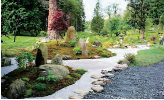
写真-34 南西側平庭枯山水全景写真