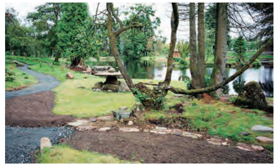
写真-48 北西側平庭、寄せ灯笼復元全景写真