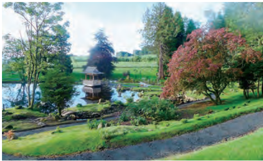
写真-51 北側フジスロープより南側庭園全景写真