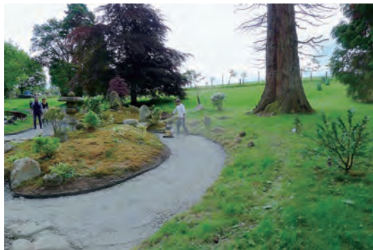
写真-17 枯山水路床砂利転圧工事