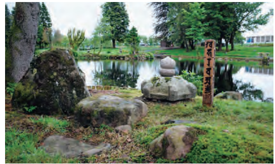
写真-47 北西側平庭既存春日灯笼傘、宝珠保存配置写真