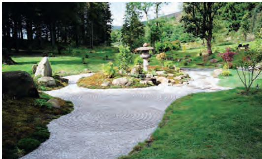
写真-35 南西側平庭枯山水全景写真