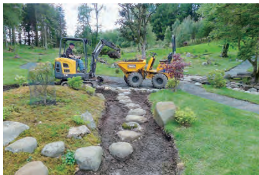
写真-12 枯山水白砂敷き土工事