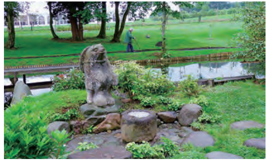
写真-30 池中央中島の日本から運ばれた狸石造物、水鉢全景写真