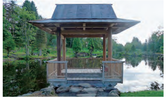
写真-38 復元された四阿全景写真