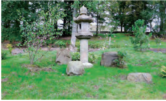
写真-50 北側斜面春日灯籠設置写真