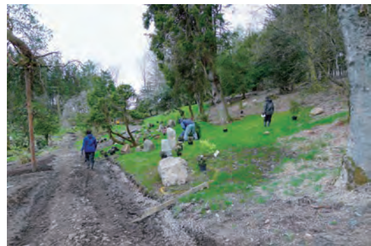
写真-3 北側斜面配植、植栽工事