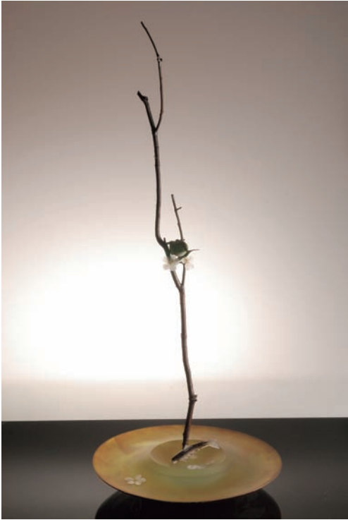
From East To West "Scene of Japan" # 95 サイズ H:980×W:400×D:405 (mm) 制作年:2012