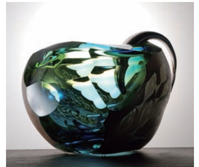
From East To West "Nagare" #62 サイズ H:270×W:365×D:330 (mm) 制作年:2008