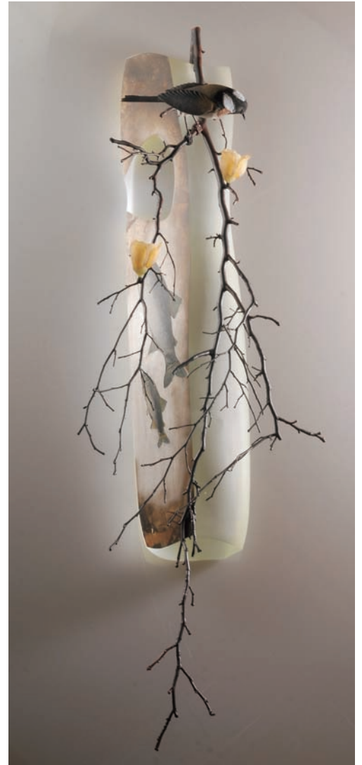
From East To West "Scene of Japan" # 160 サイズ H:860×W:250×D:200 (mm) 制作年:2014 壁掛作品