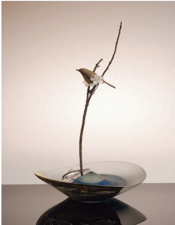
From East To West "Scene of Japan" # 82 サイズ H:510×W:340×D:330 (mm) 制作年:2012