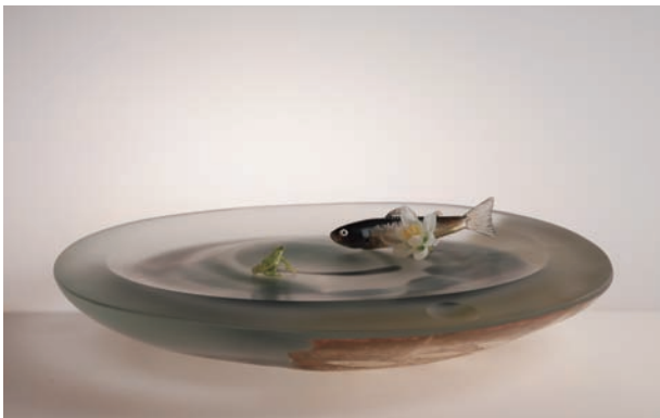
From East To West "Scene of Japan" # 11 サイズ H:85×W:565×D:560 (mm) 制作年:2010