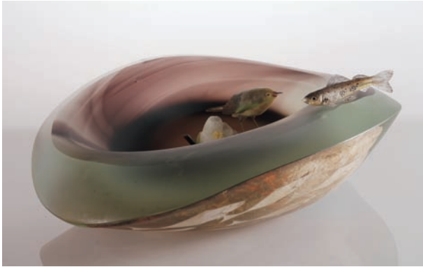
From East To West "Scene of Japan" # 39 サイズ H:130×W:475×D:405 (mm) 制作年:2011