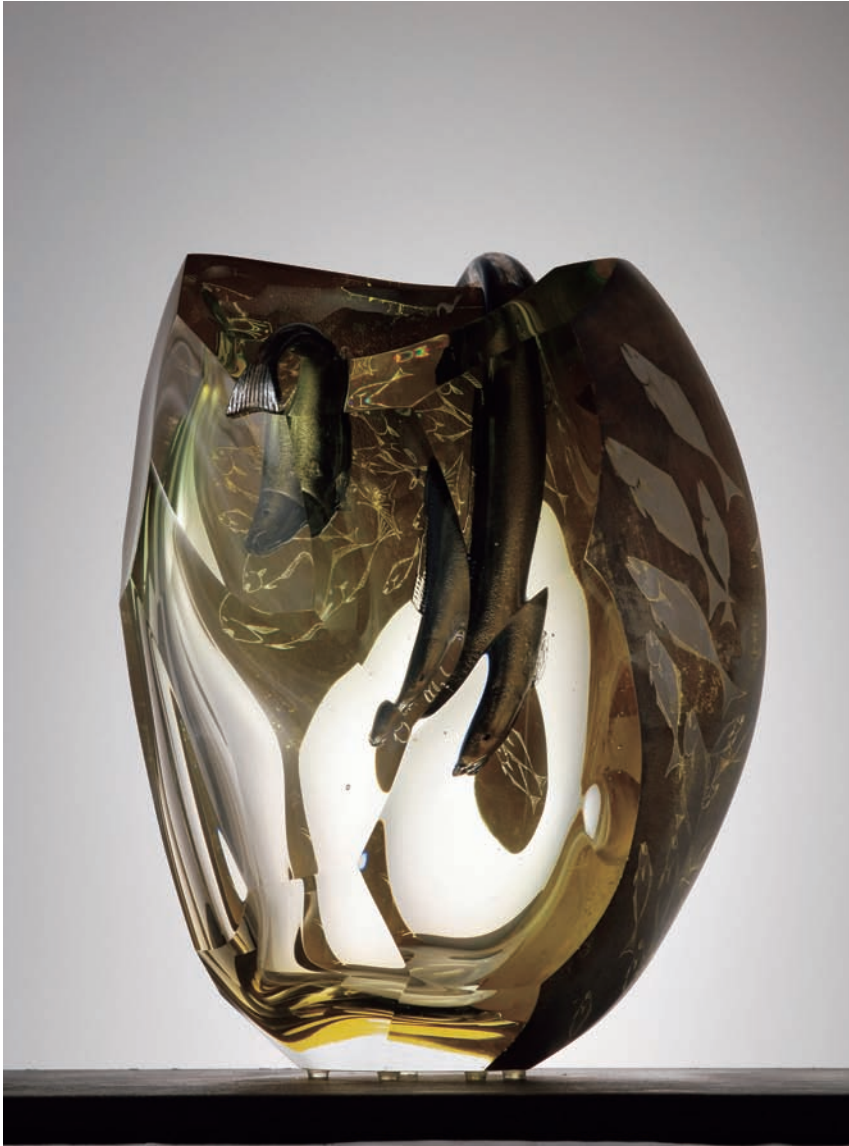
From East To West "Nagare" #92 サイズ H:440×W:330×D:240 (mm) 制作年:2008