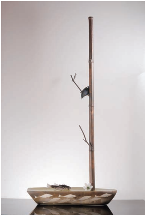
From East To West "Scene of Japan" # 161 サイズ H:1125×W:460×D:200 (mm) 制作年:2014