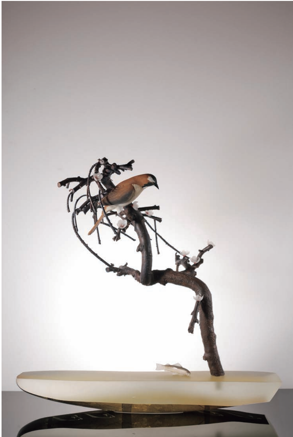
Tacoma Glass Museum レッドホット大賞受賞作品

From East To West "Scene of Japan" # 170 サイズ H:680×W:715×D:280 (mm) 制作年:2014