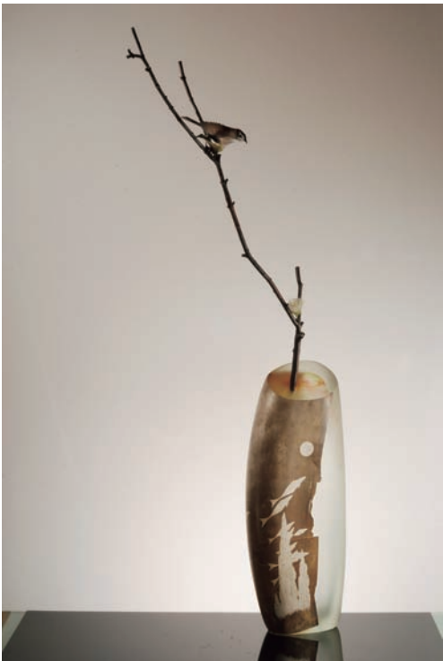
From East To West "Scene of Japan" # 127 サイズ H:1380×W:515×D:200 (mm) 制作年:2013