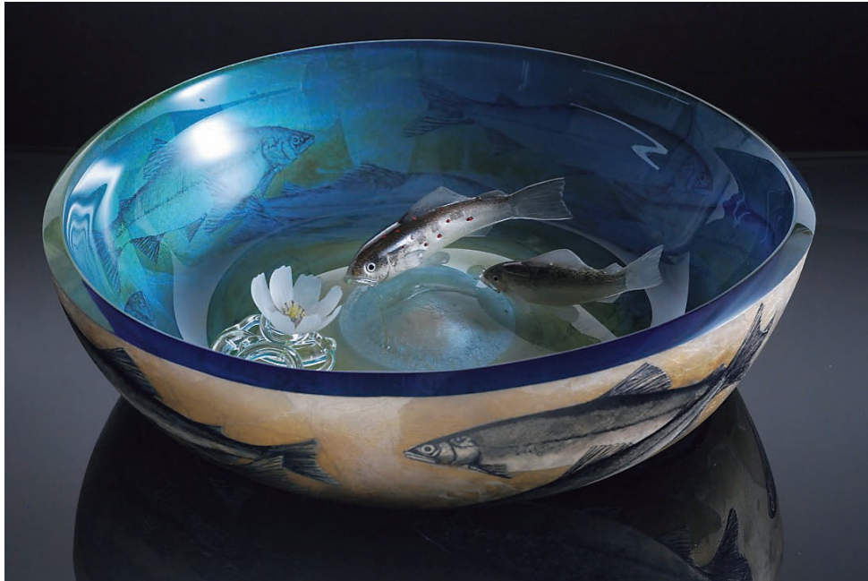
From East To West " Fish catcher in Japan" #1 サイズ H:120×W:420×D:400 (mm) 制作年:2015 技法:ホットワーク、コールドワーク、バーナーワーク、接着 銅メッキ