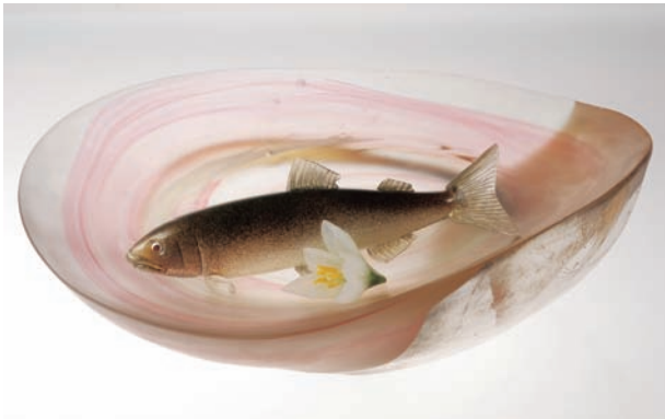
From East To West "Scene of Japan" # 1 サイズ H:110×W:390×D:360 (mm) 制作年:2010 技法:ホットワーク、コールドワーク、バーナーワーク、接着 銅メッキ