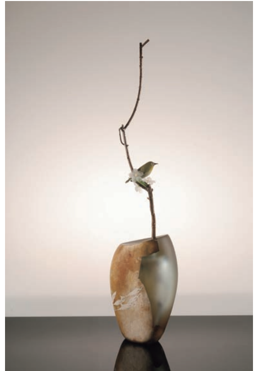
From East To West "Scene of Japan" # 105 サイズ H:800×W:180×D:100 (mm) 制作年:2012