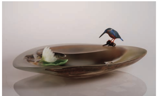
From East To West "Scene of Japan" # 24 サイズ H:90×W:575×D:520 (mm) 制作年:2010