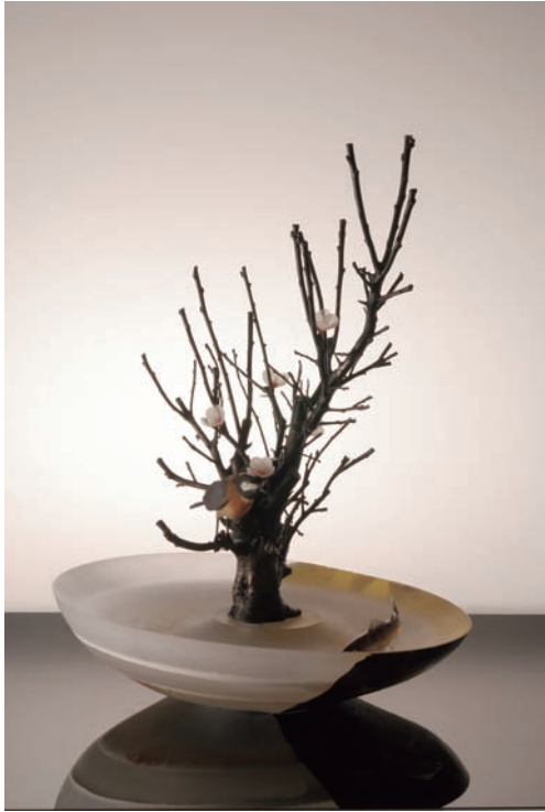
From East To West "Scene of Japan" # 130 サイズ H:570×W:405×D:405 (mm) 制作年:2013