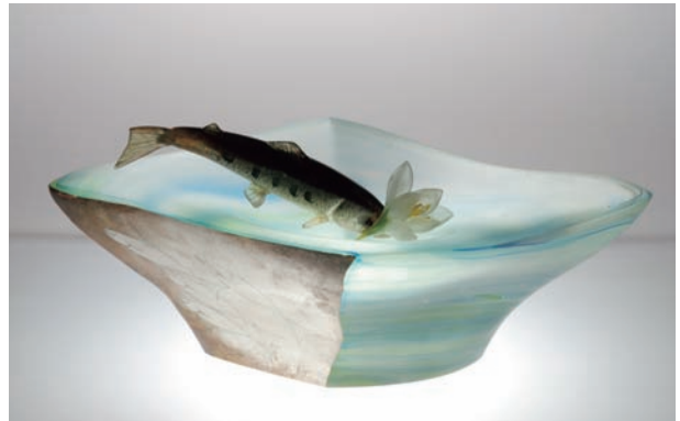
From East To West "Scene of Japan" # 3 サイズ H:120×W:380×D:235 (mm) 制作年:2010