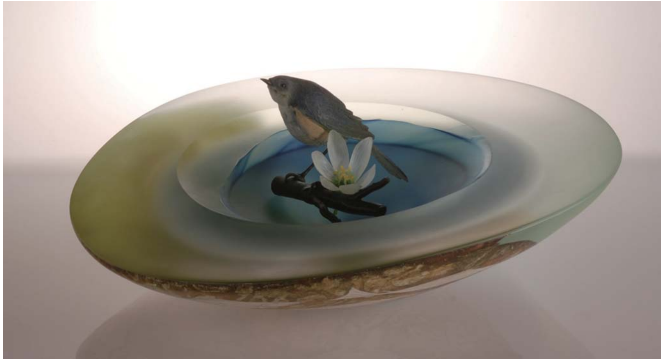
山野 宏 Scene of Japan 15.0×45.0×45.0 素材・技法 吹きガラス