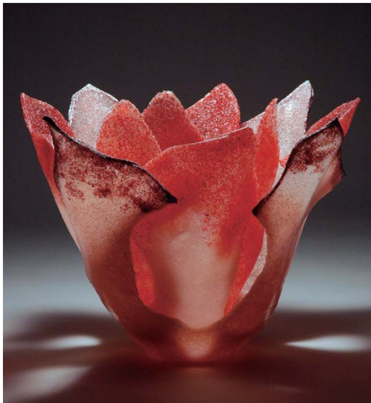
西 悦子 レッドスカーレット 32.0×52.0×52.0 素材・技法 ガラス、パート・ド・ヴェール