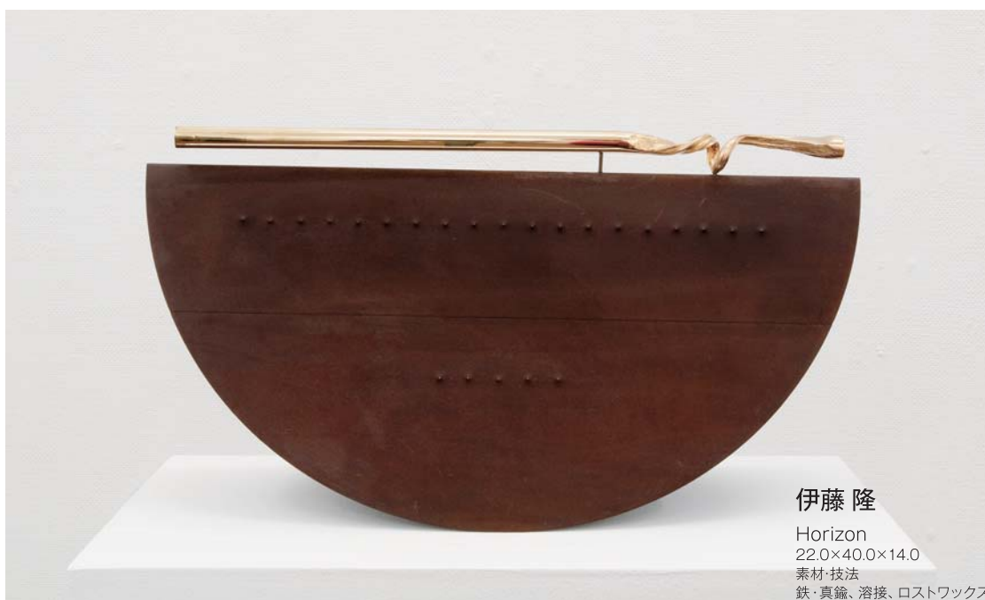
伊藤 隆 Horizon 22.0×40.0×14.0 素材・技法 鉄・真鍮、溶接、ロストワックス