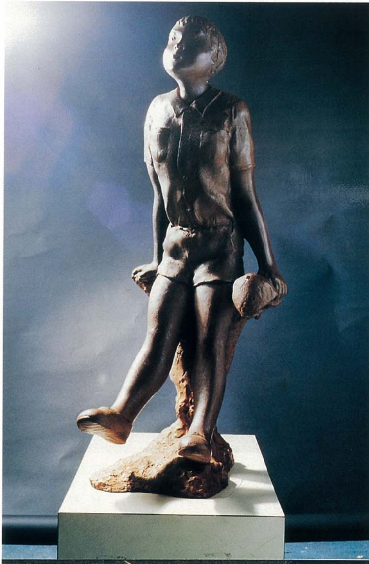
⑤ 作品名；あおぞら サイズ；H85cm×W45cm×75cm 材 料；ブロンズ（台座 赤御影石） 設置年；1986年 設置場所；大阪市庁舎