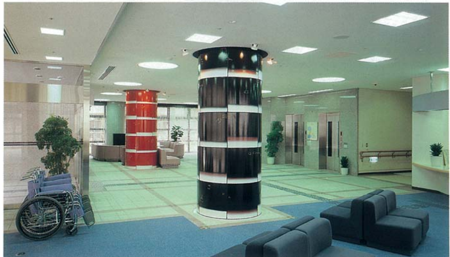
③ 作品名；宙（そら）の華 1、宙（そら）の華 2 サイズ；H 3 m×1.2mφ 2本 材 料；陶板 設置年；1996年 設置場所；茨木市立障害福祉センター