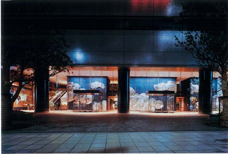
② 作品名；翔雲 サイズ；H6.6m×W29.8m 材 料；ステンレス 設置年；1983年 設置場所；近鉄堂島ビル（大阪市北区）