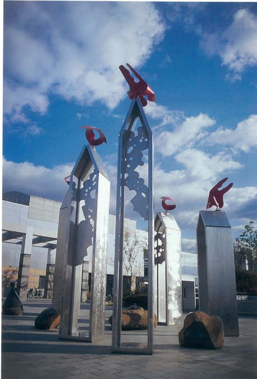
③ 作品名；コスミックバード サイズ；H10.7m×W7m×D7m 材 料；ステンレス・安山岩（伊達冠石） 設置年；1996年 設置場所；泉佐野市総合文化ホール（大阪府）