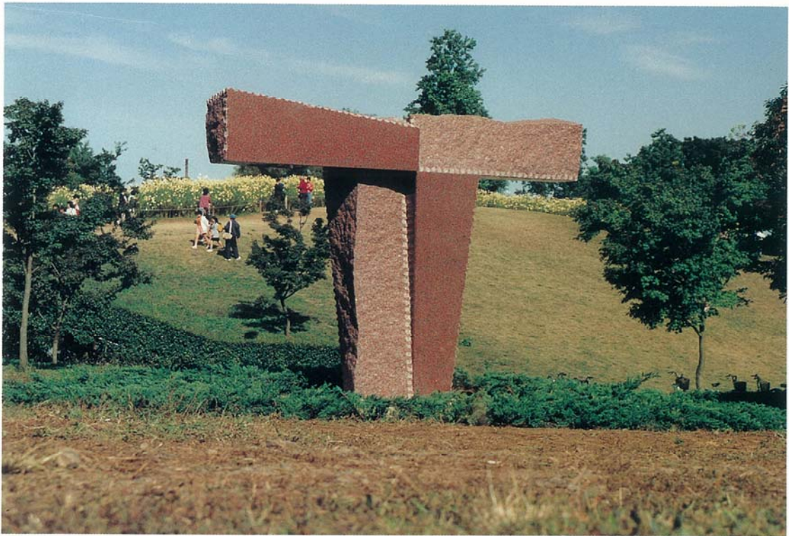
③ 作品名；インサイド アウト CT-RG サイズ；H2.3m×W3.5m×D0.8m 材 料；アフリカ産赤御影石 設置年；1993年 設置場所；立川 昭和記念公園（東京都）