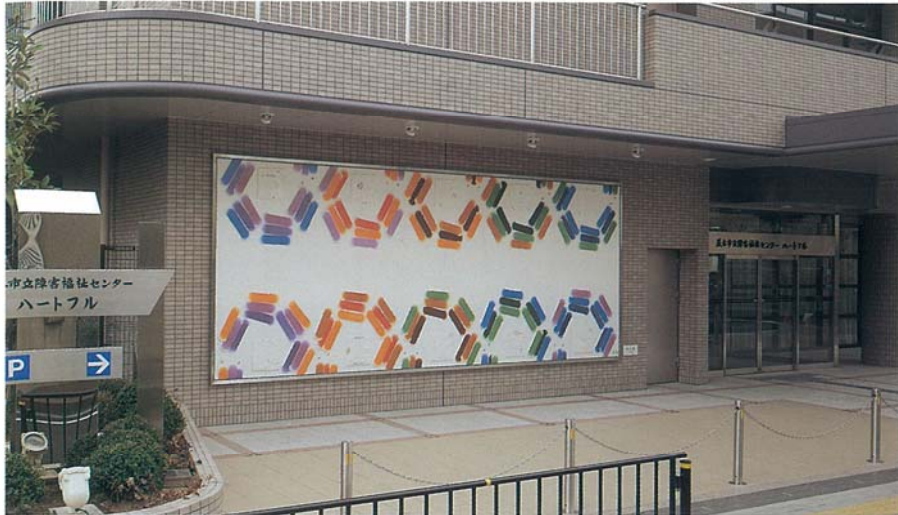
② 作品名；地の華 サイズ；H2.5m×W6.3m 材 料；陶板 設置年；1996年 設置場所；茨木市立障害福祉センター