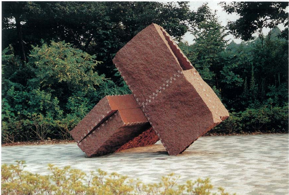
② 作品名；インサイド アウト FSB-RG サイズ；H2.4m×W2.2m×D 2 m 材 料；インド産赤御影石 設置年；1993年 設置場所；浜松 都田テクノポリス（静岡県）