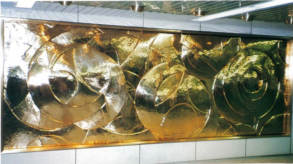
③ 作品名；夢難波（ゆめなにわ） サイズ；H1.8m×W5m 材 料；真鍮 設置年；1987年 設置場所；大阪市営地下鉄御堂筋線 難波駅