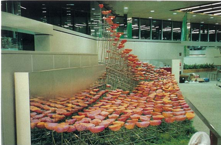
④ 作品名：浮遊華 サイズ：H4.8m×W16.6m×4.65m 材 料：FRP、ステンレス、油彩 設置年：1990年 出品場所：大阪EXPO'90 花とみどり博 光の館