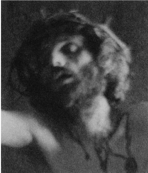
図2 『七つの言葉』習作 (Study for The Seven Words , 1898, platinum, 89×68 mm)

の磔刑のイメージ（図1）、死を直前にしたキリストの顔のクローズアップの連作（図2）、黒人をモデルとして起用した『エチオピアの王』 (2) （図3）などのイメージは、明らかに統一された気分とでもいうものを共有しており、ストレートフォトグラフィーに先行するピクトリアリズムの時代の産物としてピクトリアリズムの中に回収できてしまえそうなのであるが、なぜか釈然としない思いとともに記憶の中に居座って回帰してくる。ホモセクシャルをただちに連想させるヌードの少年たちのイメージもデイの名前と一体となって忘れられないのだ。