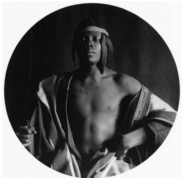
図3 『エチオピアの王（Ethiopian Monarch）』（1897）

ロマン派の詩人キーツに傾倒していたデイは、詩人に関連するもの、所縁の地などの写真撮影などで大西洋を往来してロンドンに滞在するうちに、キーツ